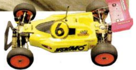
Bert Ytterhags Yokomo Super Dog Fighter Works 93 med kaross och vingfäste från Yokomo YZ-870C Super Dog Fighter. De sistnämnda detaljerna beskrev Bert som en hyllning till den första Super Dog Fightern som japanen Masami Hirosaka vann VM med 1989.